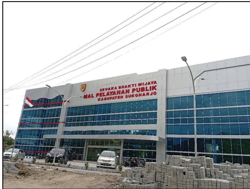
Gambar 3.7. Pembangunan Mal Pelayanan Publik Pemerintah Daerah

pelayanan secara cepat, mudah, terjangkau, nyaman, dan aman, sehingga untuk mewujudkan peningkatan Pelayanan Publik diperlukan pengelolaan Pelayanan Publik secara terpadu dan terintegrasi antara pemerintah daerah dengan kementerian, lembaga, badan usaha milik negara, badan usaha milik daerah, dan swasta dalam I (satu) tempat berupa Mal Pelayanan Publik.