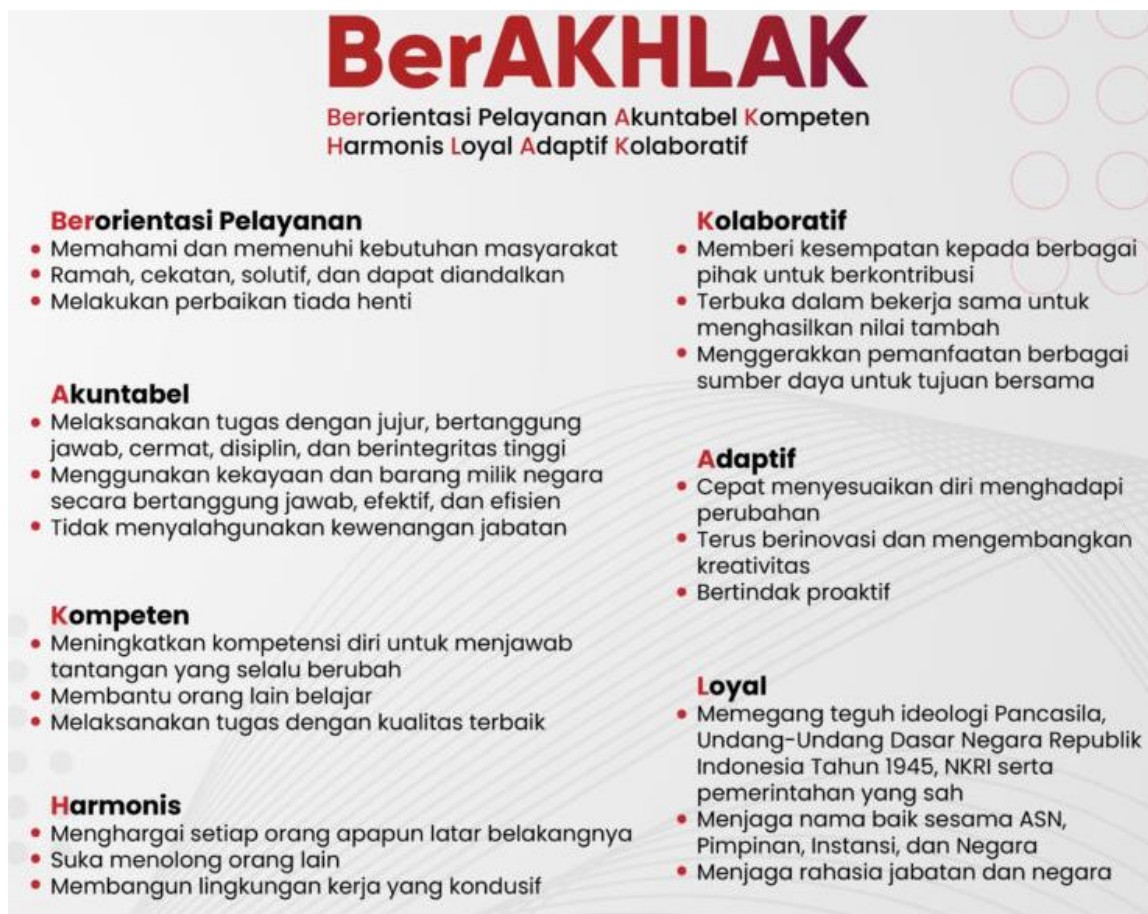
Gambar 3.6. Core Values ASN

berubah, membantu orang lain belajar serta melaksanakan tugas dengan kualitas terbaik. Keempat adalah Harmonis yaitu saling peduli dan menghargai perbaikan dengan panduan perilaku menghargai setiap orang apapun latar belakangnya, suka menolong orang lain serta membangun lingkungan kerja yang kondusif.